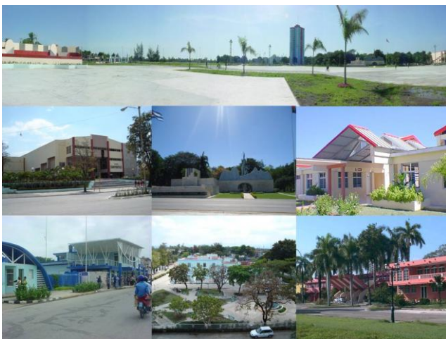
Figura 10. Subcentros de animación consolidados.

Los centros de servicio a nivel de barrio se han respetado en sentido general, aunque la zona norte es más problemática, debido a la ocupación espontánea de viviendas en las décadas del setenta y ochenta por la vía del esfuerzo propio, que ha traído como consecuencia que existan repartos con marcados déficits de áreas libres, como “Camilo Cienfuegos”, “Ciro Redondo”, Marianao, Izert y El Valle; además, los que se han podido desarrollar y preservar se localizan en los extremos de los repartos Siboney y Rosa la Bayamesa que no cumplen con los radios admisibles para una correcta accesibilidad.