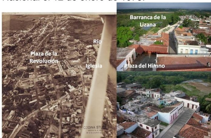
Figura 5. Imágenes de la ciudad.

El Gobierno nacional, por Decreto-Ley 483, de 30 de diciembre de 1935, “cumplió con el deber honroso de declarar a Bayamo Monumento Nacional (...) tratando de salvar para la posteridad el lugar donde los libertadores vieron la luz, del valor de los que en la ciudad combatieron con noble desinterés y de los que por ella todo lo sacrificaron” 11 (figura 5). Esta condición fue ratificada por la Asamblea Nacional el 12 de enero de 1978.