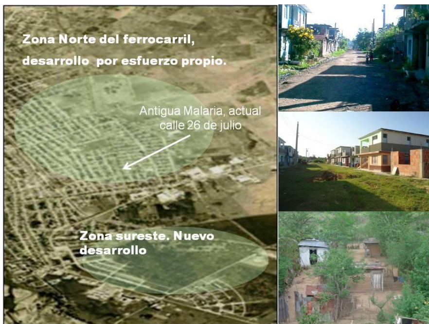
Figura 8. Imágenes de los nuevos barrios.

La edificación de un grupo de instalaciones sociales importantes marca precedentes hasta la actualidad, tal es el caso del hospital “Carlos Manuel de Céspedes”, hotel Sierra Maestra, la Terminal de Ómnibus (actualmente complejo de tiendas Las Novedades), la Escuela de Profesores de Educación Física (EPEF) “Simón Bolívar”, las sedes provinciales de la Asamblea de Poder Popular y el PCC, otras instalaciones administrativas, el teatro Bayamo y el conjunto escultórico de la Plaza de la Patria con su emblemático edificio de 18 plantas como parte del nuevo centro proyectado para la ciudad, según el Esquema de Desarrollo al 2000 elaborado en 1979 y el Plan Director de 1985, ambos por la Dirección Provincial de Planificación Física. 18