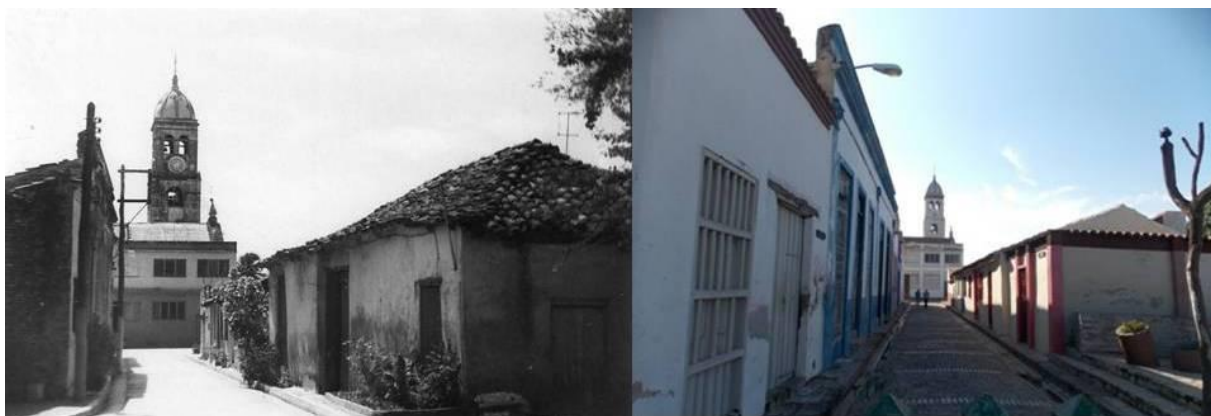
Figura 3. Imágenes de la evolución de la ciudad en su zona central.

El papel de Bayamo en las luchas independentistas limitó su desarrollo económico y social. Sobre las ruinas dejadas por el incendio, la ciudad se levantó lentamente de nuevo manteniendo el mismo trazado vial y en general los usos de la tierra. Al terminar la Guerra de Independencia se perdió toda su riqueza y gran parte de su patrimonio edificable quedó prácticamente inhabitable con una reducida población, 9 a comienzos del siglo xx era algo mayor de 4 mil habitantes (figura 3).