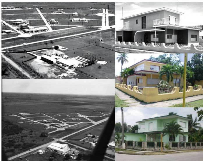
Figura 6. Imágenes del reparto Nuevo Bayamo.