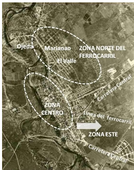
Figura 4. Localización de los nuevos barrios y la zona centro.

Comienza en la ciudad el auge constructivo cuando se solicitan los primeros permisos para edificar sobre ruinas o solares yermos. 10 Entre 1910 y 1935 el centro urbano se expande en sentido contrario al crecimiento físico de la ciudad, al traspasar el umbral del trazado del ferrocarril con un desarrollo anárquico y espontáneo, que se agudizó con el transcurrir del tiempo, al aparecer nuevos barrios en los hoy conocidos repartos de El Valle, Marianao y Ojeda, caracterizados por condiciones deplorables, sin acueducto, alcantarillado ni drenaje, e incluso había partes donde no llegaba la electricidad. Allí estaba instalada esencialmente la clase pobre, los obreros y campesinos que venían a la ciudad buscando trabajo (figura 4).