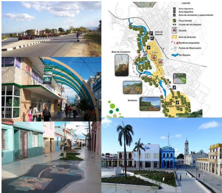
Figura 9. Imágenes de la Circunvalación Sur y espacios públicos revitalizados.

espacios públicos, parques, plazas y el área recreacional de descanso y comercial del río Bayamo (La Vega), figura 9.