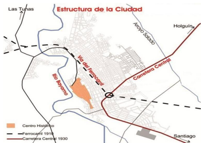
Figura 1. Localización del Centro Histórico dentro de la ciudad.

La ciudad de Bayamo es una de las urbes de mayor importancia de la Isla, ubicada en la zona suroriental de Cuba en el municipio homónimo, capital de la provincia de Granma. El proceso de formación ha estado vinculado a su propio emplazamiento, margen derecha de su principal accidente geográfico, el río Bayamo, y a sus corredores de comunicación que han sido además elementos determinantes en la estructuración, unidos a trascendentales acontecimientos históricos y políticos que fueron modelando el espacio físico (figura 1).