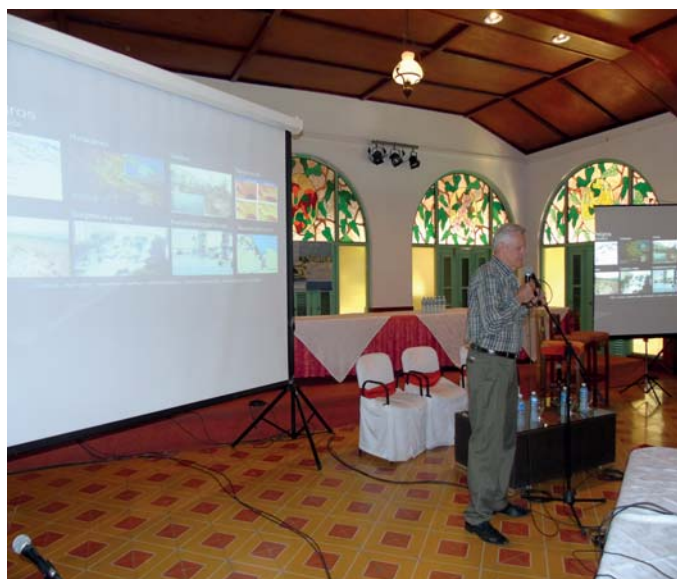
Conferencia: Ciudades costeras por Carlos M. Rodríguez, Foto: Ernesto Rodríguez López (Ernestico)

A continuación, se desarrolló el panel: Autoridades locales opinan moderado por el Arquitecto Miguel Padrón,