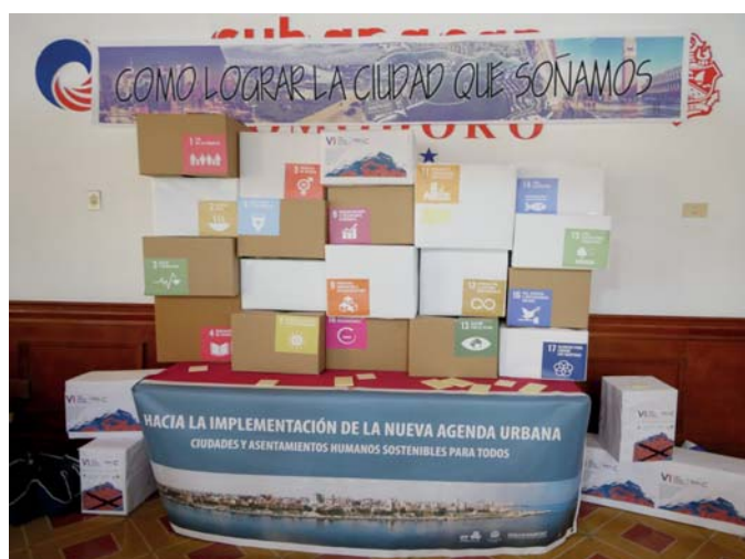
El Muro, espacio participativo en el FUN.