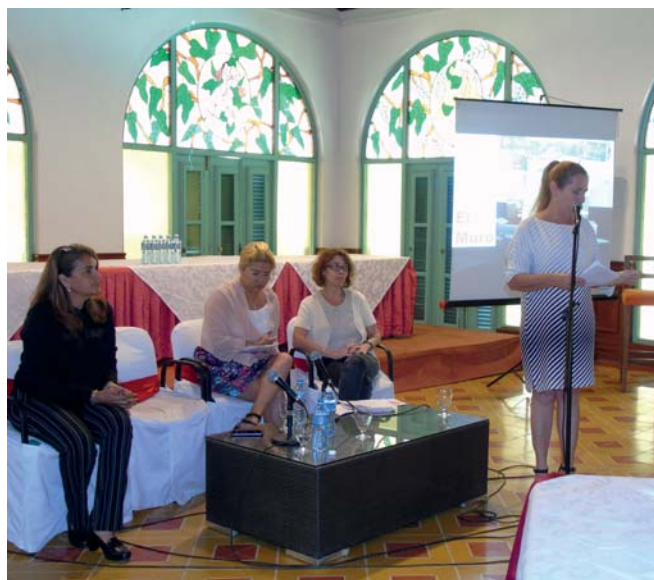
Devolución de las consideraciones de los participantes en El muro

crisis y conflictos. Mencionó la importancia de los recursos y fuentes de financiamiento para enfrentar el reto de los ODS.