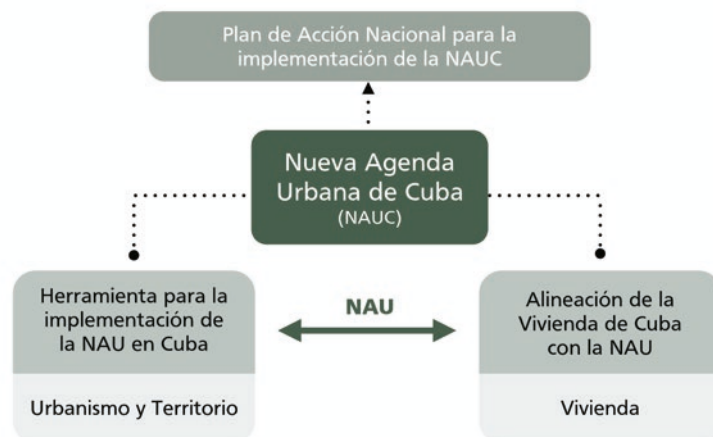
Figura 2. Relación del documento de alineación del sector vivienda en Cuba con la NAU y el PAN.

Los talleres temáticos sobre la vivienda, realizados para la elaboración del presente documento tuvieron entre sus objetivos, proponer acciones como posibles soluciones o mitigación de los problemas existentes. La metodología seguida a través de ejercicios participativos consistió en la conformación de matrices que vinculan y cruzan los pilares de la NAU con áreas fundamentales del desarrollo de la vivienda en Cuba. Este documento constituye un insumo para el Plan de Acción Nacional y la implementación de la NAU en Cuba, como puede verse en la Figura 2.