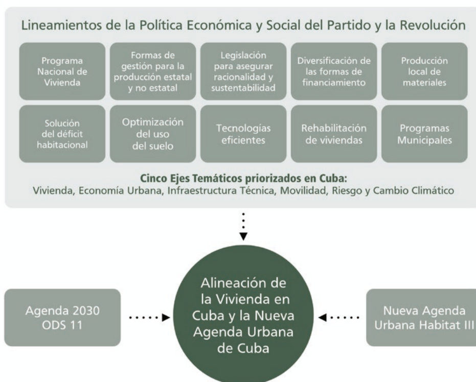
Figura 3. Lineamientos de la Política Económica y Social del Partido y la Revolución y ejes temáticos prioritarios de Cuba.

En el Anexo 1 se muestran los resultados detallados.